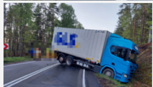
W wypadku na DK21 ucierpiał 20-letni kierowca w Volkswagena