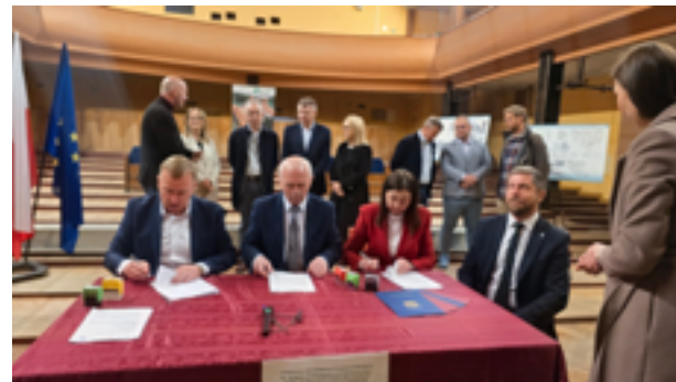
Uroczyste podpisanie umowy z wykonawcą budowy nowego BCK

– I do widzenia. Zapraszamy do nowego – mówi pracownica BCK