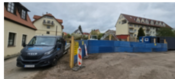
Za bytowskim urzędem miejskim obok harcówki powstaje garaż. Łączny koszt całej inwestycji to 1,5 miliona złotych

– Wiem, że to dziwnie zabrzmiało: mieliśmy 300 tys. zł, mamy półtora miliona. Ale kosztorys inwestorski opiewał w ogóle na 1,7 mln zł. Z przetargu