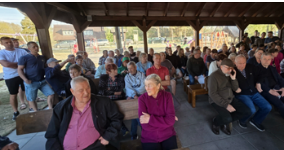
Mieszkańcy Soszycy nie chcą dopuścić do utworzenia rezerwatu