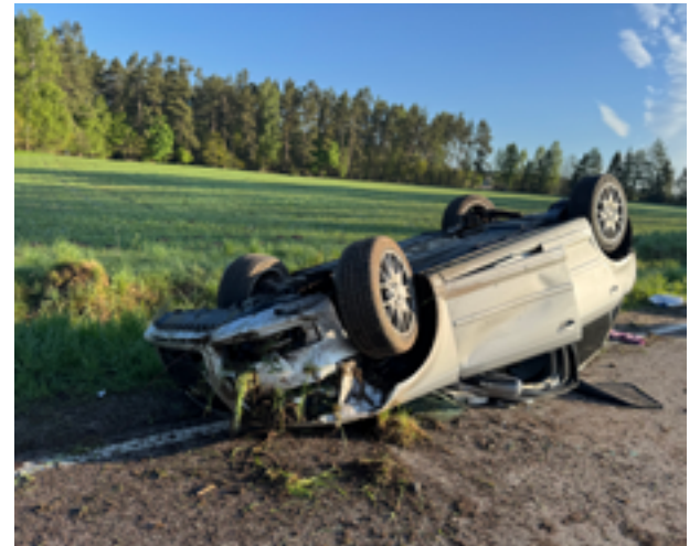
Pijany 22-letni kierowca Audi dachował na drodze wojewódzkiej nr 212 w Kleszczyńcu

Brygada zaznacza, że jest dumna z opanowania, profesjonalizmu i gotowości swojego żołnierza do niesienia pomocy drugiemu człowiekowi.