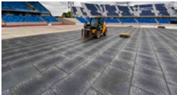
Mniej więcej takie specjalne maty ochronne mają zostać położone na bytowskim stadionie, aby zabezpieczyć murawę podczas Dni Bytowa.

Tegoroczne Dni Bytowa mają odbyć się na głównej płycie stadionu. Pod nogami uczestników znajdzie się więc murawa, z której na co dzień korzystają piłkarze. Gmina zapewnia, że trawa zostanie zabezpieczona specjalnymi matami. Koszt takiego rozwiązania może wynieść nawet 100-120 tys. zł. Sprawa wywołała dyskusję wśród radnych i ostre komentarze mieszkańców.