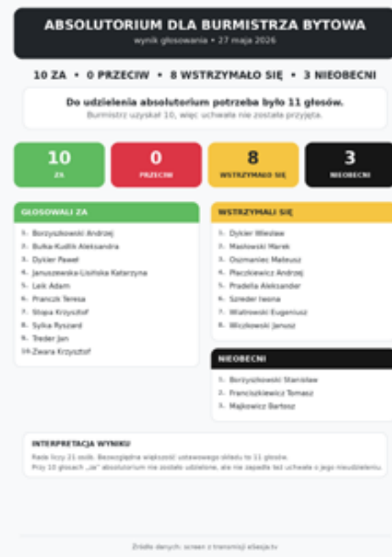
Wyniki głosowania dotyczące udzielenia absolutorium burmistrzowi

To nie jest jeszcze polityczne trzęsienie ziemi zakończone referendum. To raczej wyraźne ostrzeżenie. Burmistrz wyszedł z sesji bez wotum zaufania i bez absolutorium, a rada pokazała, że kolejnych decyzji nie zamierza przyjmować bez pytań.