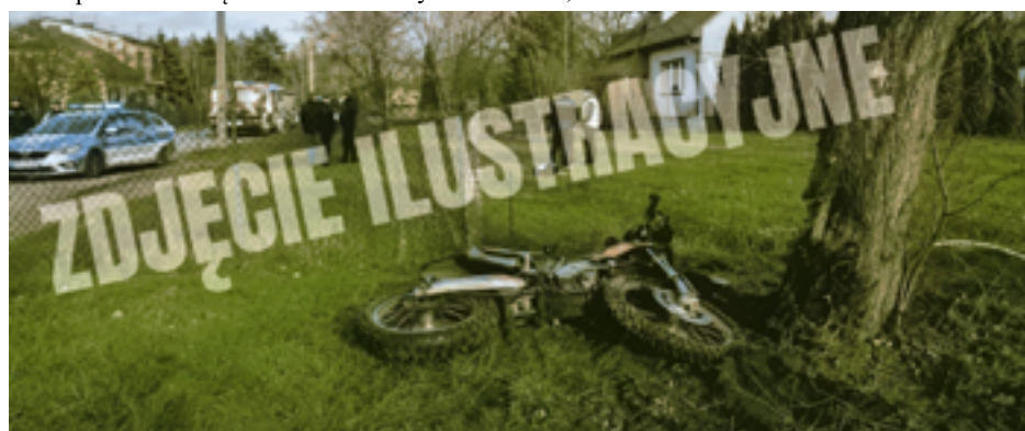
Na prywatnym torze crossowym w Rokicinach zginęła 15-letnia córka właścicieli tego terenu