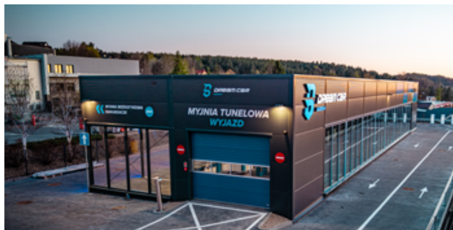
Dream Car Wash - najnowocześniejsza myjnia tunelowa w regionie