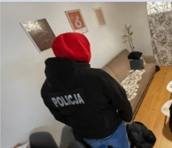
36-latek z powiatu lęborskiego przyznał się do winy i uzgodnił karę. Chodzi o kradzież z włamaniem na prywatnej posesji w Tuchomiu. Z domu zniknęły worki z gotówką