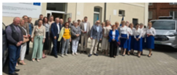
Seniorzy z Bytowa oficjalnie otworzyli nową siedzibę przy ul. Młyńskiej

– Robimy to od 2016 roku. W tym roku to już będzie jedenasty festiwal – zapowiada przewodniczący stowarzyszenia.