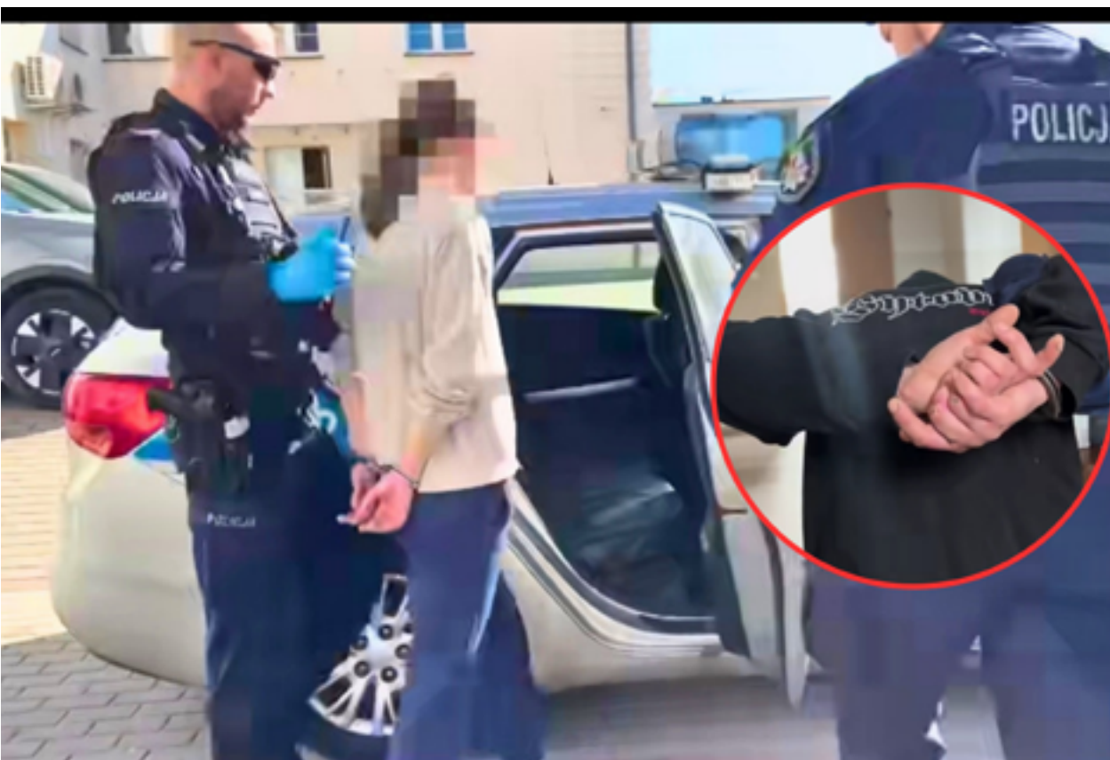
Podejrzani w sprawie ataku na 12-latkę zostali zatrzymani i doprowadzeni do prokuratury przez policję

To już nie jest tylko internetowe nagranie, które poruszyło mieszkańców. To postępowanie karne, w którym dwoje dorosłych odpowiada za atak na 12-letnie dziecko.