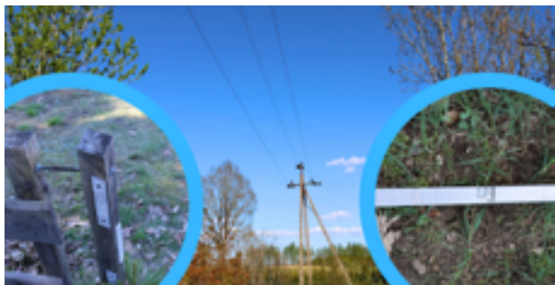
Przyczyną nieszczęśliwego wypadku był metalowy szlaban, który dotknął linii energetycznej