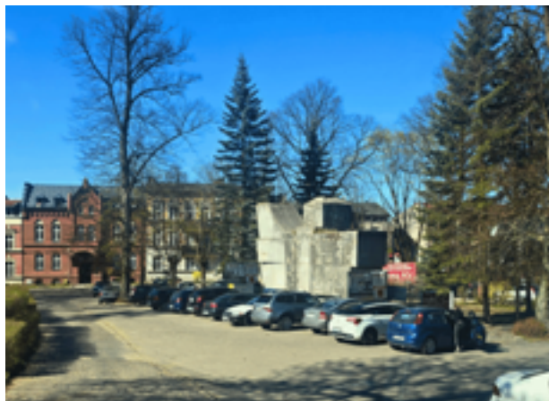
Betonowy Światowid w najbliższych miesiącach ma być rozebrany

Zmiany na placu Krofeya w Bytowie budzą coraz większe emocje. Najpierw mieszkańcy usłyszeli o planowanej likwidacji parkingu, teraz dochodzi kolejny drażliwy temat.