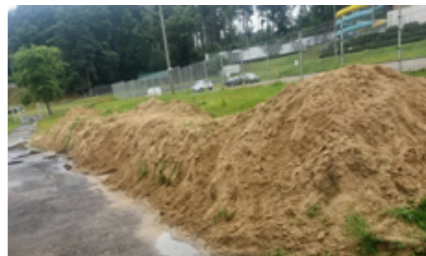
To przyczyna nagłego zakończenia kariery byłego już prezesa basenu. Sprawę rok temu ujawnił nasz Czytelnik

– Niewątpliwym faktem jest to, że błędem jest w ogóle pomysł taki, żeby oddawał własny piasek z budowy, chcąc