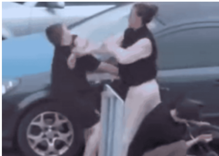
Kadr z nagrania, które w naszych mediach obejrzało kilkaset tysięcy osób z całej Polski. 20-letnia kobieta atakuje 12-latkę, a jej znajomy spuszcza powietrze z roweru